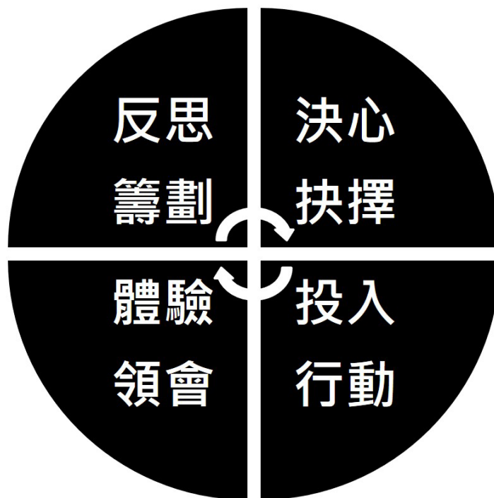
圖二 在世存有之行動與詮釋循環歷程

盧怡任與劉淑慧（2015）則進一步引用Merleau-Ponty的觀點來闡明處境結構（Merleau-Ponty, 1945/1962）。人總是活在被拋處境中，也總是必須承擔起自己的抉擇自由和責任（May, 1983）。所謂處境結構是由處境與籌劃所共構，處境結構不是主觀的，因為它承載著人的既成歷史以及周身他人及用具之事實性，這些都不是個人所能選擇與控制的；但處境結構也不是客觀的，因為人總是站在自己的立場，把自己、他者與世界看成「如何為我所用之物」來加以理解與籌劃，籌劃投出了不同於當下處境的未來可能性，讓人得以領會、改變與超越處境，讓處境為籌劃所照亮（Merleau-Ponty, 1945/1962）。